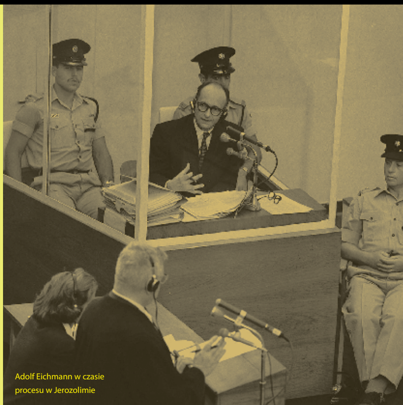
Adolf Eichmann w czasie procesu w Jerozolimie