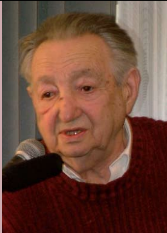
Marek Edelman, Warszawa 2006 r.