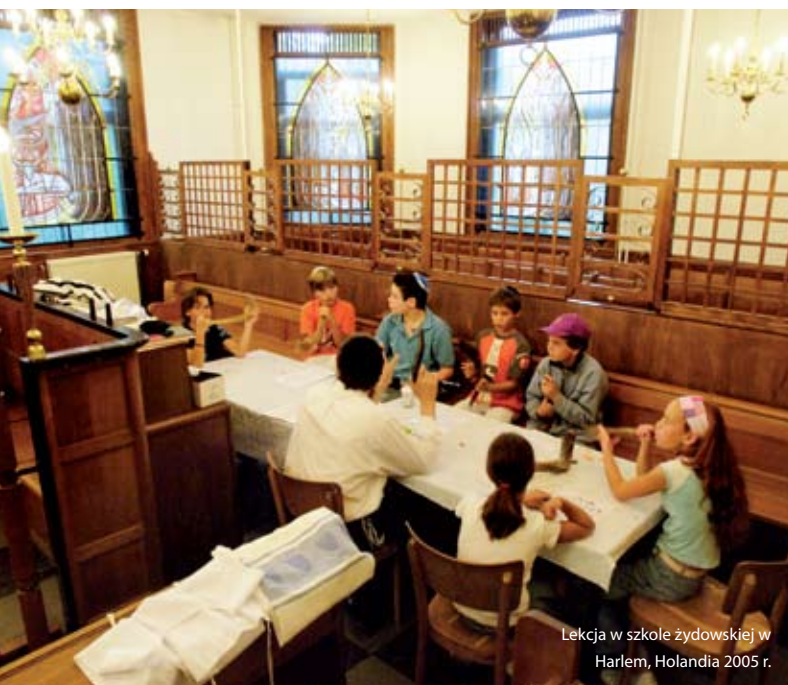
Lekcja w szkole żydowskiej w Harlem, Holandia 2005 r.