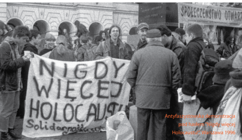
Antyfaszystowska demonstracja pod hasłem "Nigdy więcej Holocaustu", Warszawa 1996