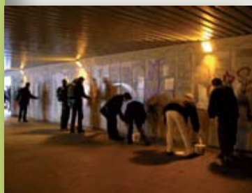
Grupa młodych ludzi zamalowuje rasistowskie napisy