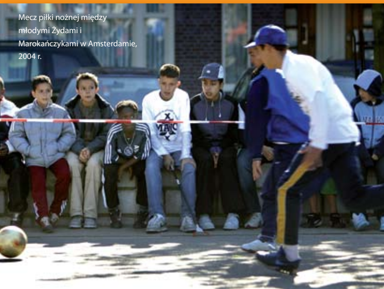
Mecz piłki nożnej między młodymi Żydami i Marokańczykami w Amsterdamie, 2004 r.