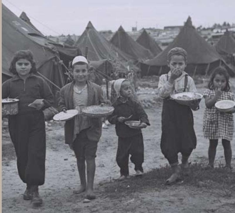
Dzieci żydowskie po przyjeździe do Izraela, 1948 r.

Żydzi zaczęli emigrować z Europy do Palestyny w XIX w., uciekając przed antysemityzmem. Powiększali istniejące tam żydowskie społeczności, które powstawały na terenach nabywanych od arabskich właścicieli ziemskich. Sprawujący na tym obszarze władzę Brytyjczycy dali nadzieję mieszkającym tam Żydom i Palestyńczykom na powstanie ich własnych państw. Pragnienie obydwu grup posiadania własnego państwa narodowego na tym samym obszarze stało się zarzewiem konfliktu o ziemię, który trwa do dzisiaj. Na początku 1947 r. Wielka Brytania ogłosiła wycofanie się z tych terenów, a w listopadzie ONZ przyjęła rezolucję o podziale dawnego brytyjskiego terytorium mandatowego na dwa państwa: żydowskie i arabskie. Niemniej