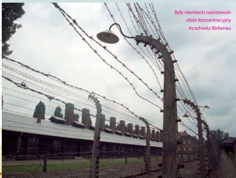
Były niemiecki nazistowski obóz koncentracyjny Auschwitz-Birkenau

A. Dlaczego polski minister edukacji wybrał 19 kwietnia, a Organizacja Narodów Zjednoczonych – 27 stycznia? Wyjaśnij specjalne znaczenie tych dat.