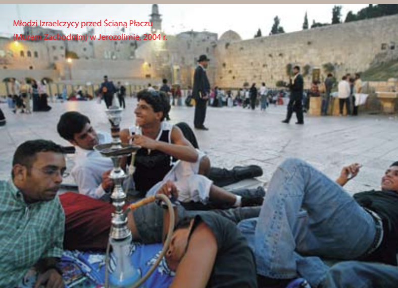
Młodzi Izraelczycy przed Ścianą Płaczu (Mur Zachodni) w Jerozolimie, 2004 r.

to nazwa nadana przez Rzymian jednej z prowincji Imperium Rzymskiego obejmująca tereny dzisiejszego Izraela i Terytorium Autonomii Palestyńskiej. W następnych wiekach teren ten był częścią Imperium Tureckiego. W latach 1914-1947 znajdował się pod zarządem brytyjskim, jako terytorium mandatowe Palestyny.