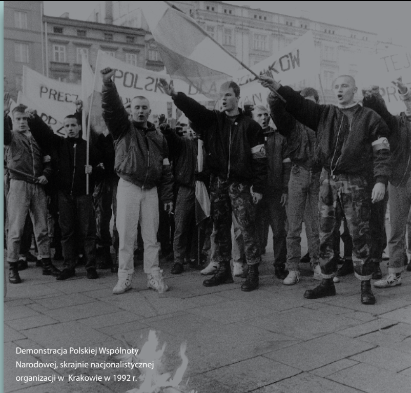
Demonstracja Polskiej Wspólnoty Narodowej, skrajnie nacjonalistycznej organizacji w Krakowie w 1992 r.

Antysemityzm nie zaniknął bynajmniej po wyzwoleniu. W Europie i w Stanach Zjednoczonych