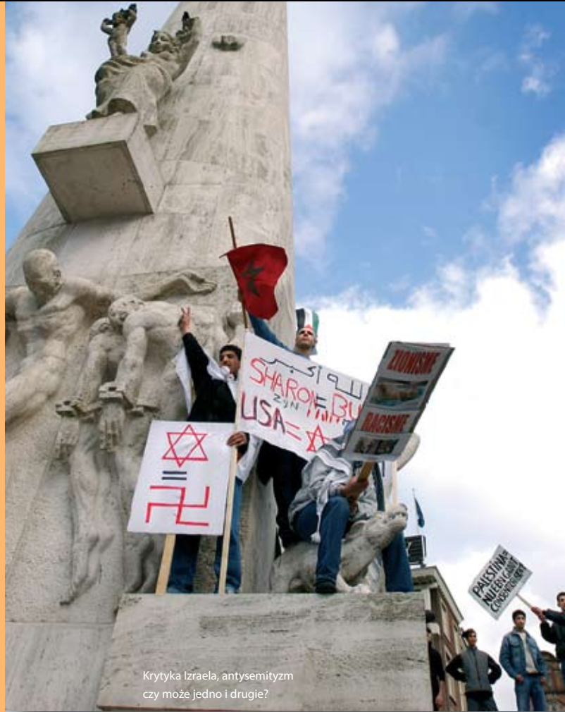
Krytyka Izraela, antysemityzm czy może jedno i drugie?

Żydzi są regularnym celem ataków poza Izraelem. W 2003 r. doszło w Casablance do ataków na kilka budynków, w których znajdowali się Żydzi. Zginęło 54 ludzi. Natychmiast po zamachach Marokańczycy wyszli na ulicę, by zaprotestować przeciwko nim.