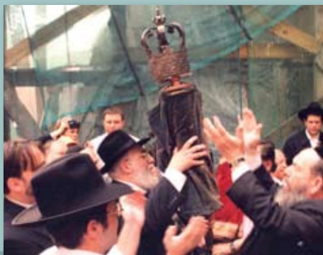
Powrót Tory. Uroczyste przekazanie, odnalezionego po latach, Tory krakowskiej synagodze Remuh w 1996 r.