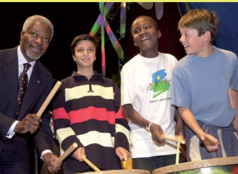
Kofi Annan, Sekretarz Generalny ONZ do 2006 r., podczas ceremonii zamykającej Światowy Festiwal Dzieci, który się odbył w Bazylei (Szwajcaria) w 2000 r. Kiedyś wypowiedział te słowa: „Zwalczając antysemityzm, walczysz o przyszłość całej ludzkości”.