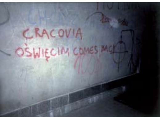
„Oświęcim comes back” – graffiti w jednym z podziemnych przejść w Krakowie

aktywnie działają liczne grupy neonazistowskie. Tak jak Hitler uznają one „białą rasę” za lepszą od innych. Neonaziści występują przeciwko mniejszościom narodowym i religijnym, a zatem także przeciwko Żydom. Utrzymują, że to sami Żydzi wymyślili Holokaust, by zdobyć poparcie dla stworzenia własnego żydowskiego państwa. Twierdzą ponadto, że dziennik Anny Frank nie jest autentyczny, lecz został napisany po wojnie.