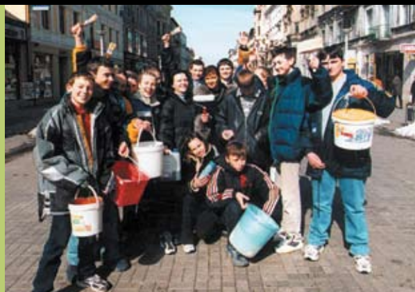
Grupa młodych ludzi na jednej z głównych ulic Łodzi

Pierwszego dnia wiosny setki młodych ludzi wychodzą na ulice Łodzi, by wyrazić swoją dezaprobatę wobec autorów wulgarnych i rasistowskich napisów, które można spotkać w miejscach publicznych na murach, parkanach i frontonach kamienic. Światowy Dzień Walki z Rasizmem został ustanowiony przez UNESCO i obchodzony jest 21 marca. W tym dniu zarówno młodzi, jak i dorośli wychodzą na ulice z farbą i pędzlami, by zamalowywać obraźliwe napisy.